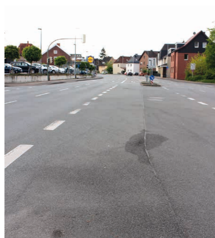
So sieht's aus: Noch hat der Stadtring vier Fahrspuren für Autos.

Trotz heftiger Kritik und guten Gegenargumenten hält die Stadt an ihren Plänen fest, den Stadtring umzugestalten. Wie berichtet, soll die Straße künftig statt vier nur noch zwei Fahrspuren haben, stattdessen sollen beidseitig Radwege angelegt werden. Beschlossen wurde die Maßnahme im vergangenen Dezember mit äußerst knapper Mehrheit in der Bezirksvertretung Brackwede mit den Stimmen von SPD, Grünen und Linken. Auch der Stadtentwicklungsausschuss stimmte mehrheitlich den Plänen zu.