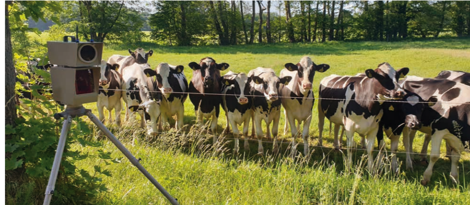
Und es hat „blitz“ gemacht: Interessiert verfolgt die Herde die polizeilichen Aktivitäten

Wahrscheinlich staunten die Rindviecher nicht schlecht, als ein Audi Q7 mit 107 Km/h an ihnen vorbeifuhr, obwohl die Autofahrer hier doch nur 60 km/h fahren dürfen. Auch der Fahrer eines Mercedes Sprinter wird mit seinen 89 km/h für mächtig Aufsehen gesorgt haben. Auf etwas mehr Ruhe können die Rinder an ihrer schönen Weide nun hoffen. Die zwei Fahrer müssen nämlich mit einem Fahrverbot rechnen.