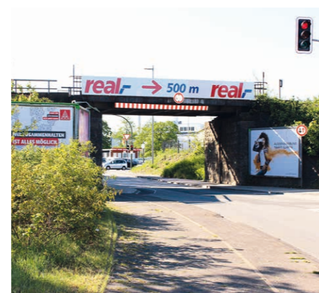
Engpass: Für Autos steht im Sommerloch lediglich eine Fahrspur zur Verfügung.

Rückblick: Seitdem der Fußgängertunnel als kürzeste Verbindung zwischen Quelle und Brackwede wegen der Umbauarbeiten am Brackweder Bahnhof gesperrt ist, müssen Fußgänger und Radfahrer einen Umweg durch die Bahnunterführung in Kauf nehmen. Um den lästigen Umweg für diese schwachen Verkehrsteilnehmer wenigstens halbwegs sicher zu gestalten, wurden unter der Brücke breite Fuß- und Radwege angelegt. Das hatte zur Folge, dass dem Autoverkehr auf einer Strecke von etwa 30 Metern dort lediglich eine Fahrspur zur Verfügung steht. Eine Ampel regelt den Verkehr und gibt abwechselnd jeweils eine Fahrtrichtung frei. Die Konsequenz: Vor allem zu Stoßzeiten stauen sich die Autos sowohl auf der einen als auch auf der anderen Seite der Unterführung oft auf mehrere hundert Meter.