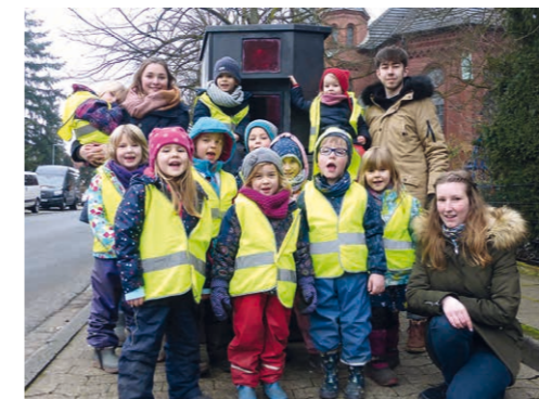
Tolle Kiste zu Besuch: Die angehenden Schulkinder haben sich das Messgerät zusammen mit ihren Erziehern genau angeschaut und es bei seiner Arbeit beobachtet.