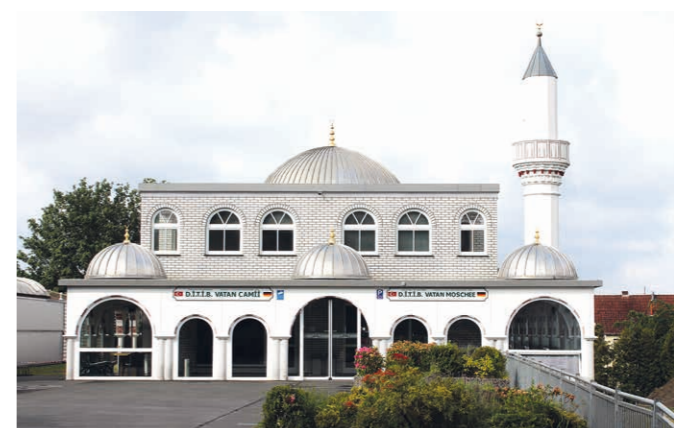
Hat die Brackweder CDU in Harnisch gebracht: Die Vatan-Moschee an der Windelsbleicher Straße.