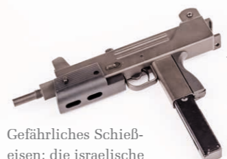
Gefährliches Schieß-eisen: die israelische Maschinenpistole „Uzi“.

Im alten Chicago gehörte die Maschinenpistole (MP) quasi zum täglich gebrauchten Handwerkszeug von Ganoven wie „Scarface“ Al Capone. Bei uns in Brackwede findet man die gefährlichen Bleispritzen heute eher selten. Umso überraschter war die Polizei, als ihr ein Monteur im Mai letzten Jahres meldete, er habe bei einer Fahrstuhlreparatur eine MP vom Typ „Uzi“ gefunden. Umfangreiche Ermittlungen führten die Kripo dann zu einem Wohnungsmieter, der allerdings Stein auf Bein schwor, mit der übrigens voll funktionsfähigen Waffe nichts zu tun zu haben.